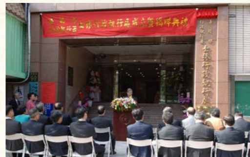
95年1月1日增設士林行政執行處揭牌