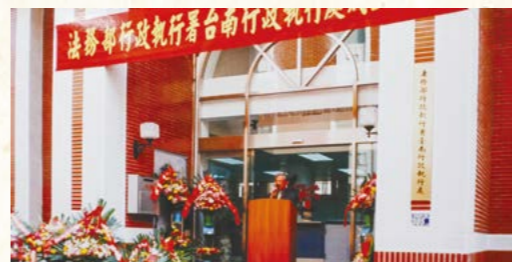
90年1月1日本署所屬12個執行處之一臺南行政執行處揭牌