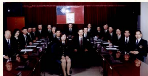
91年11月21日第23次行政執行業務會報合影