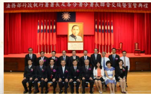
105年9月1日新任署長及分署長聯合交接典禮