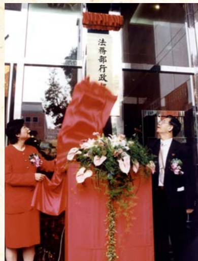
89年1月1日本署佈達揭牌

本署及13個分署乃兼具行政機關、準司法機關、事業機關三合一獨特而優質的組織，並以基本責任額為中心，實施「目標管理、績效評比」制度，同時建立與形塑「執行有愛，公義無礙」、「行為有度，寬容有路」、「一方有難，八方支援」的文化，據以奠定良好的執行基礎。