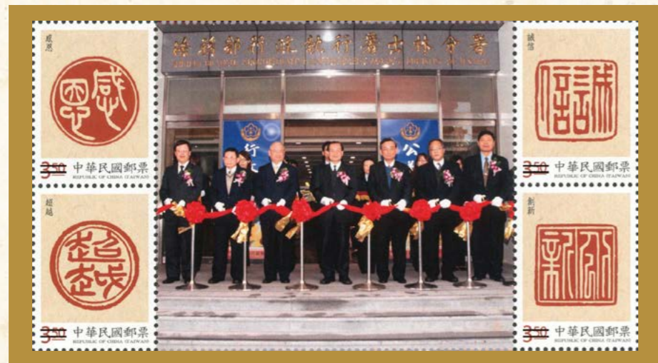
102年1月8日本署及士林分署辦公廳舍落成啓用