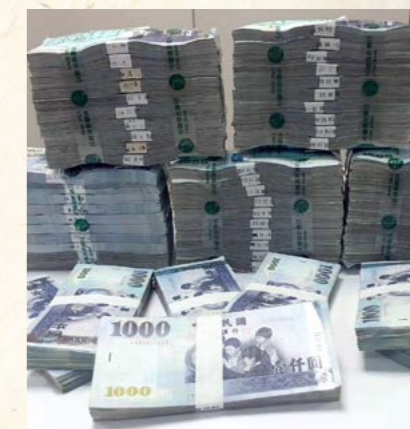
義務人為免管收速以現金繳清案款