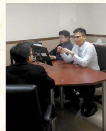
執行官詢問義務人