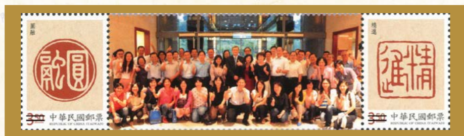
104年9月22日頒發執行績效優良獎