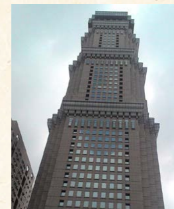
長谷生活科技股份有限公司「長谷世貿」大樓

長谷生活科技股份有限公司負責人逃匿大陸十餘年，高雄分署除積極拍賣公司不動產外，並查獲負責人將財產移轉至大陸經營事業，年營收 10 億元，承辦行政執行官策動負責人回國，再向法院聲請管收，共清償 3 億 5,204 萬餘元。