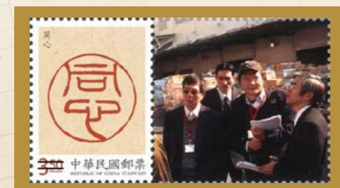
彰化分署迅雷強力執行