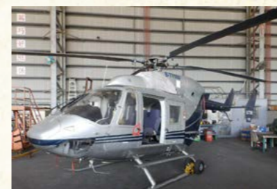
臺北分署拍賣義務人所有之直升機