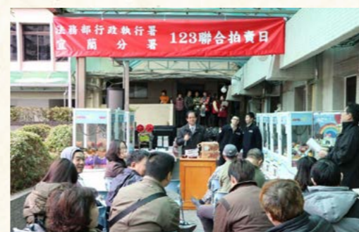
宜蘭分署拍賣日場場爆滿