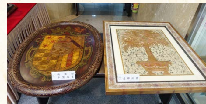
士林分署動產拍賣