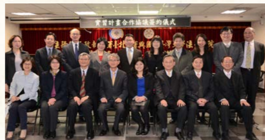
臺北分署與臺灣大學簽約儀式

此合作機制運行多年，法學理論得以與實務相結合，可提升法學教育品質，強化學生未來職場競爭力，引導培育行政執行專業人才。