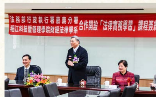
嘉義分署與稻江管理學院簽約儀式