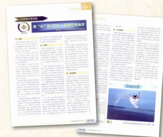
法務通訊刊登文化大學實習學生感言