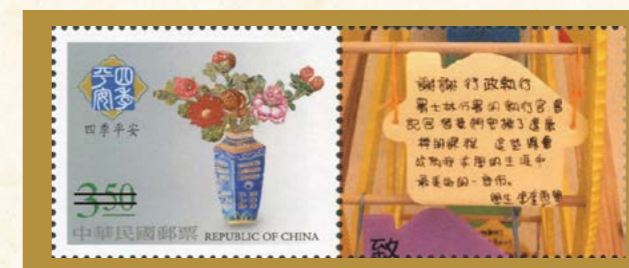
真理大學學生至士林分署實習感言