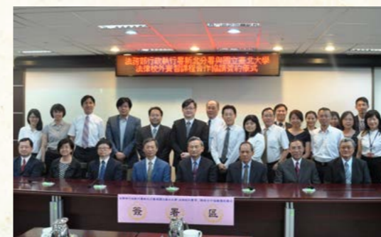
新北分署與臺北大學簽約儀式