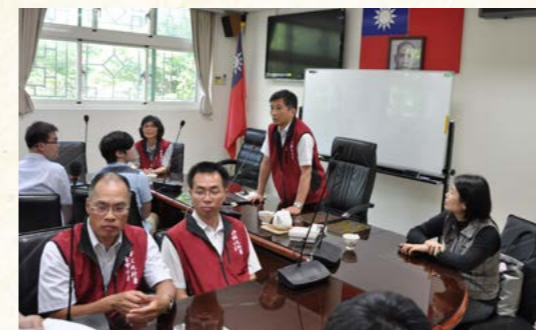
亞洲大學學生至臺中分署實習實況