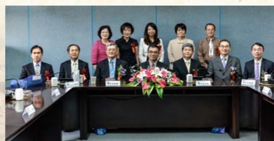
嘉義分署與中正大學簽約儀式