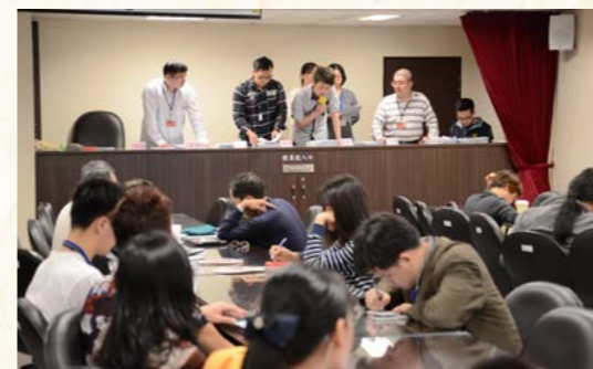
臺大學生至臺北分署實習實況