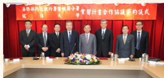
桃園分署實習計畫合作協議簽約儀式