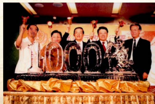
施部長茂林主持1,000億元成果展破冰儀式