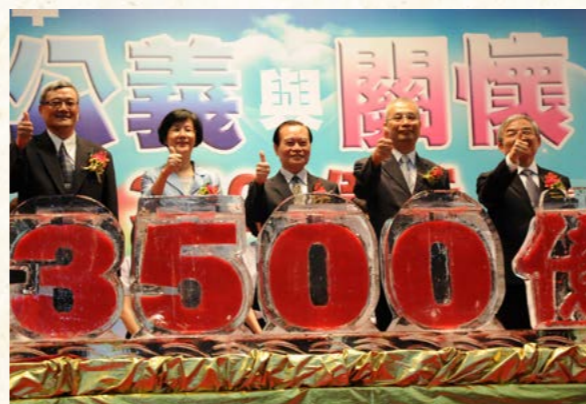
曾部長勇夫主持3,500億元成果展績效挹法國庫儀式