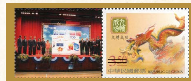
102年7月10日13位分署長參與「公義與關懷成果展—執行績效突破3,500億元活動」